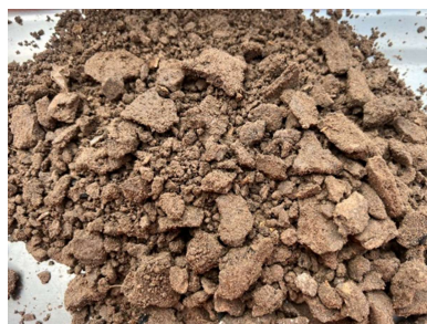
ชุดดินจักราช (Ckr-B)