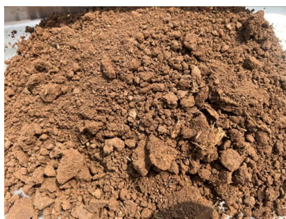
ชุดดินลพบุรี (Lb-B)