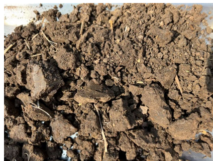
ชุดดินโนนไทย (Nt-A)