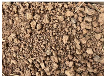
ชุดดินชุมพวง (Cpg-B)