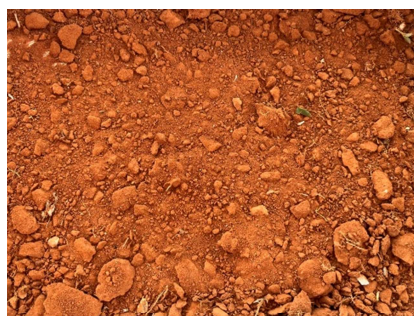
ชุดดินมหาสารคาม (Mk-B)