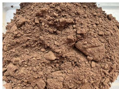
ชุดดินบ้านไผ่ (Bpi-B)