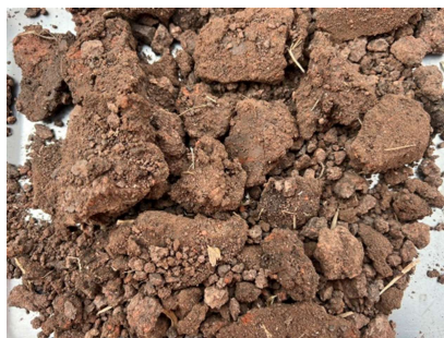
ชุดดินจัตุรัส (Ct-B)